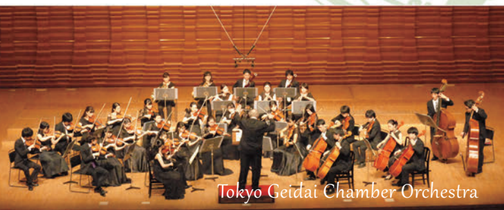
Tokyo Geidai Chamber Orchestra

Tokyo Geidai Chamber Orchestra The 33rd Regular Concert